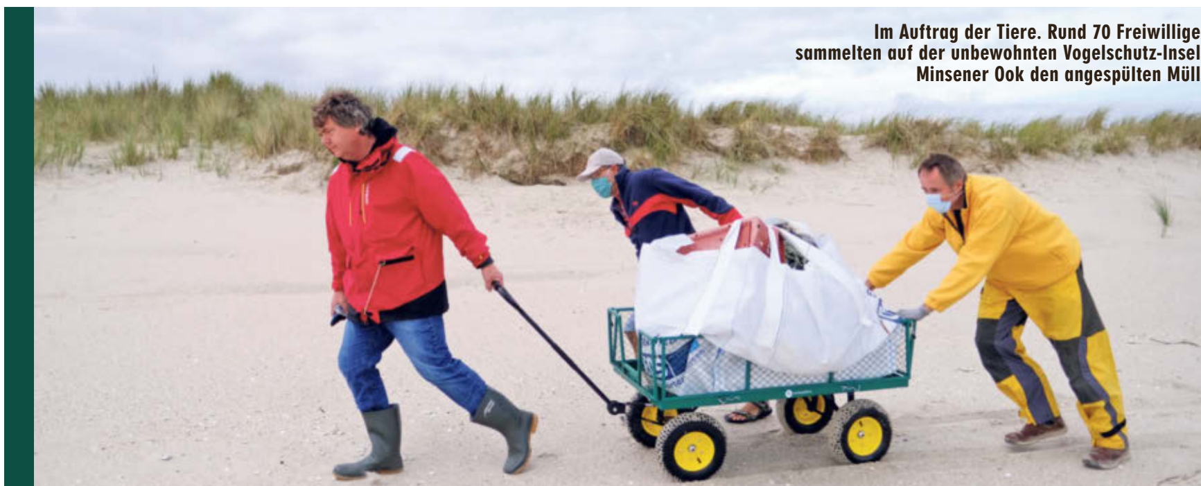
Im Auftrag der Tiere. Rund 70 Freiwillige sammelten auf der unbewohnten Vogelschutz-Insel Minsener Ook den angespülten Müll

Zehn Kunstwerke der malenden Elefantenkuh „Sita“ brachten dem Zoo bereits 2000 Euro ein. Dafür spritzt die Dickschäuterin mit ihrem Rüssel Kleckse aus lebensmittelleichten Farben auf eine Leinwand. 14 Bilder sind noch für 149 bis 199 Euro zu haben. Der Erlös fließt in die Tierhaltung dort und ein Elefantenschutzprogramm in Thailand.