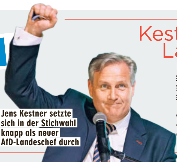
Jens Kestner setzte sich in der Stichwahl knapp als neuer AfD-Landeschef durch